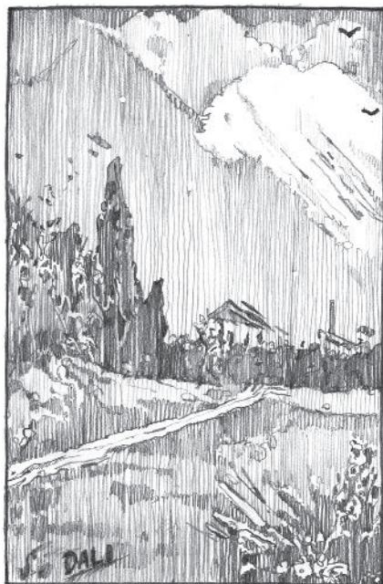
Peisaj de Dalí, 1914

Lui Salvador îi plăceau țărmul stâncos și bărcile ancorate în portul din Cadaqués.