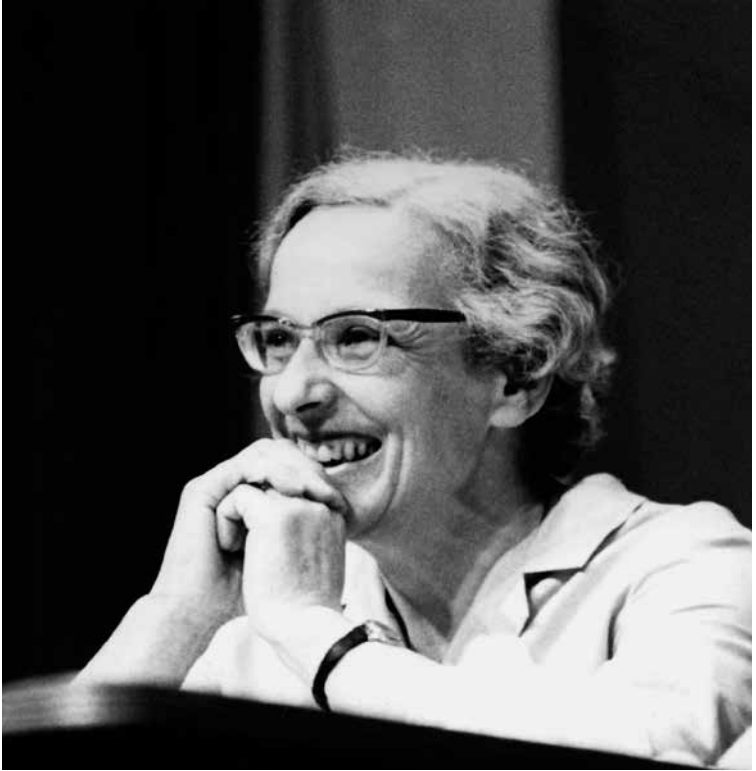
Marie-Louise von Franz 1915-1998